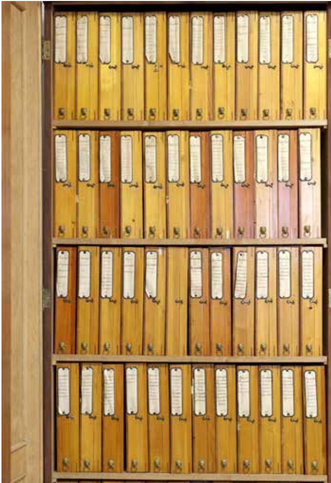
Unser Titelbild: Analoge Wissenspeicher im Lübecker Naturkundemuseum.